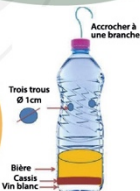
Accrocher à une branche

Le vin blanc repousse les abeilles ! Renouvelez le contenu toutes les deux semaines. Ne pas laver le piège!